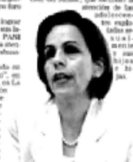
Solo con la colaboración de toda el pueblo será posible controlar los abusos sexuales contra los menores de edad, dijo la presidenta del PANI, Maribel Gómez.

Este programa de atención se brinda en los albergues "El Caribú", en Tres Ríos, y el "Tío Toro", en La Estrella del Atlántico. La atención integral a esta población se ofrece, no sólo a través de